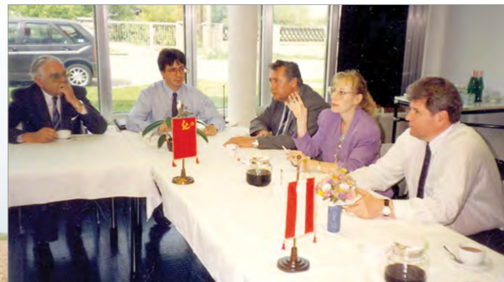
Прием делегации из Австрии