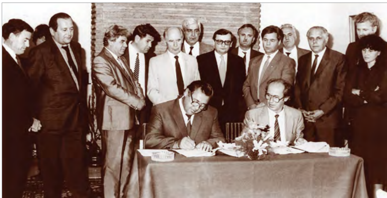
Подписание соглашения о сотрудничестве в строительстве комплекса перерабатывающих предприятий с югославской делегацией