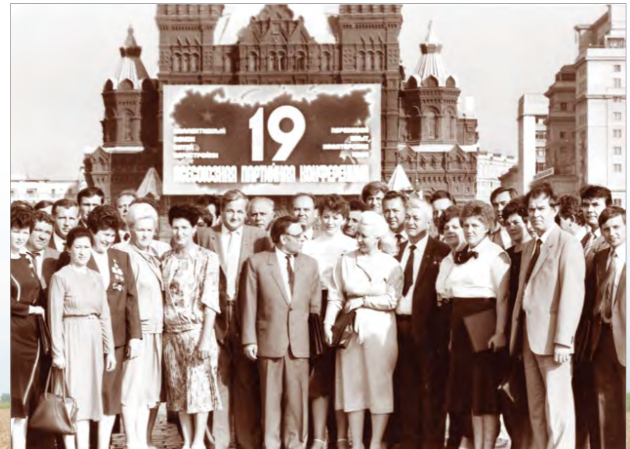
Делегация Краснодарского края во главе с первым секретарем крайкома КПСС И. К. Полозковым

К концу 1990 года многие стройки, в том числе и комплекс перерабатывающих предприятий в АПК «Кубань», были заморожены. А так как модель АПК «Кубань» была схожа с тогдашней моделью нашего государства, то непонимание между производителями