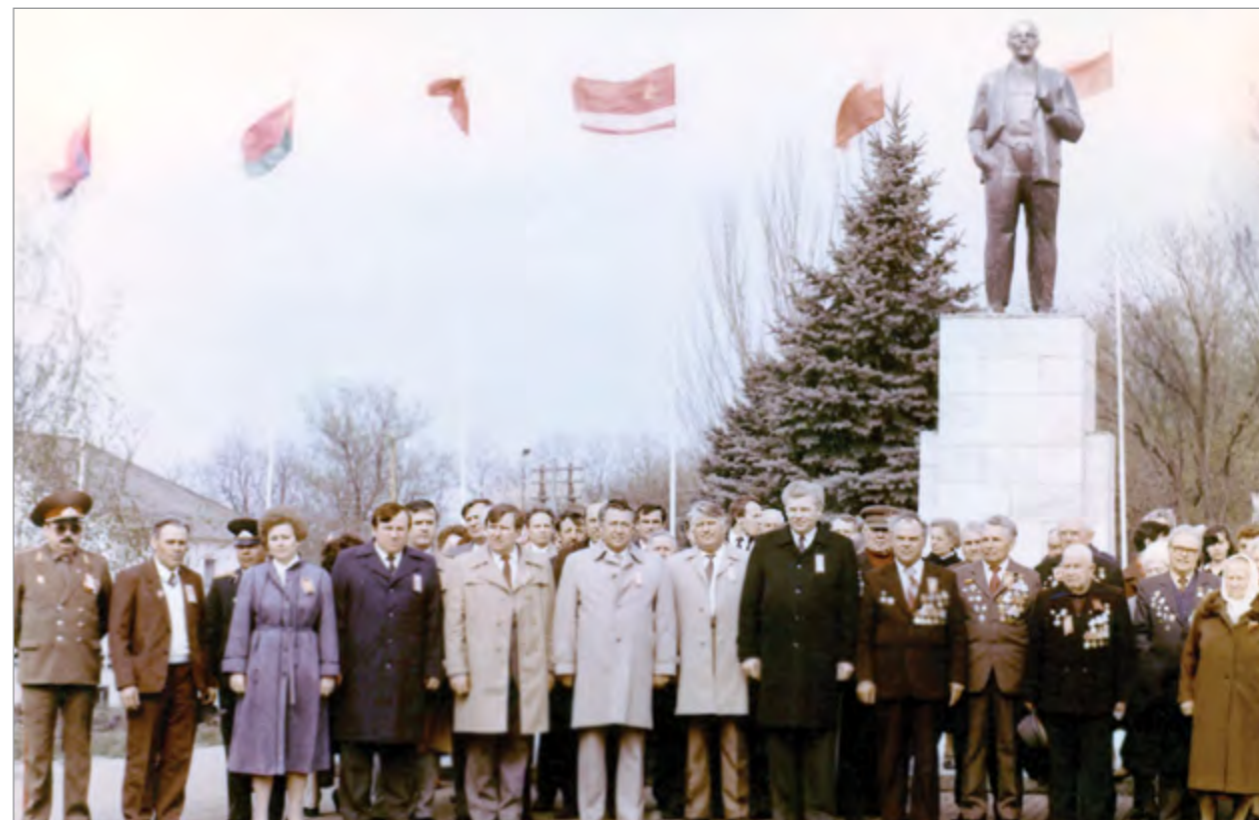
Администрация Тимашевского района с ветеранами Великой Отечественной войны