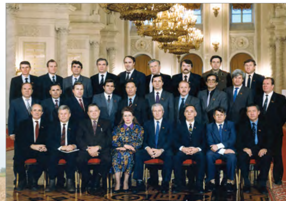
Делегация Краснодарского края в Кремле

И именно аграрная Кубань, где люди особой стати, особой ответственности, умеющие трудиться, где патриотический дух, как никогда, высок, должна показать пример».