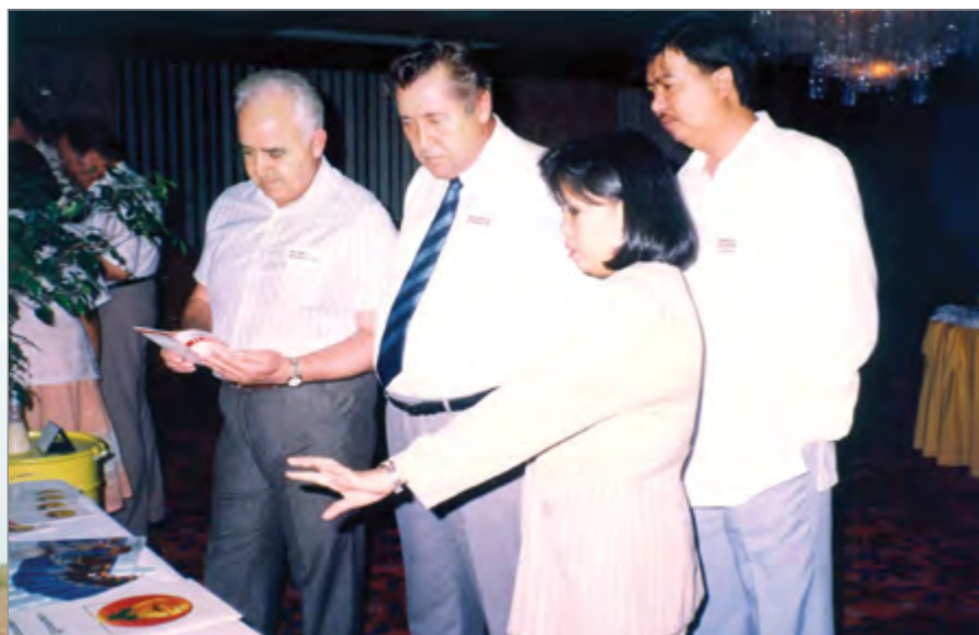
Представители Филиппинских островов в гостях у АПК «Кубань»

время настойчиво отстаивать интересы комбината в общении с иностранными партнерами.