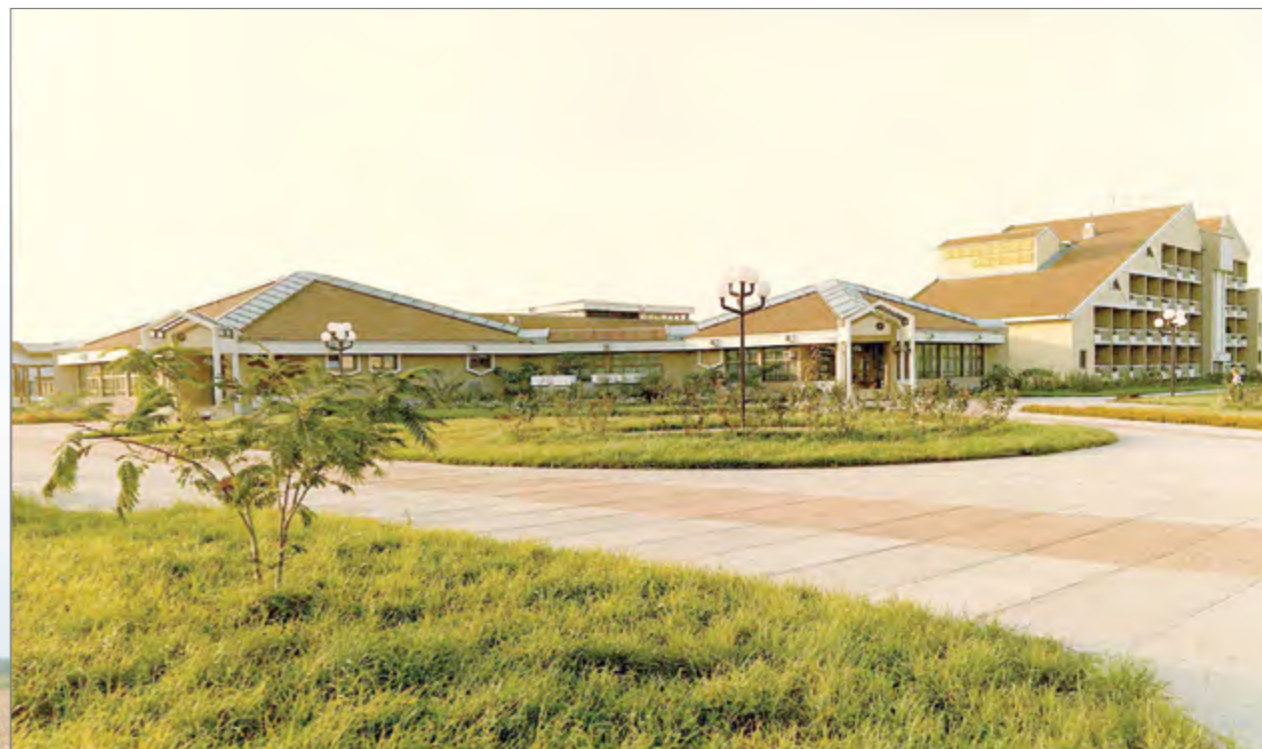
Жилые коттеджи и объекты соцкультбыта поселка Садовод, построенные в конце 80-х годов прошлого века югославскими строителями