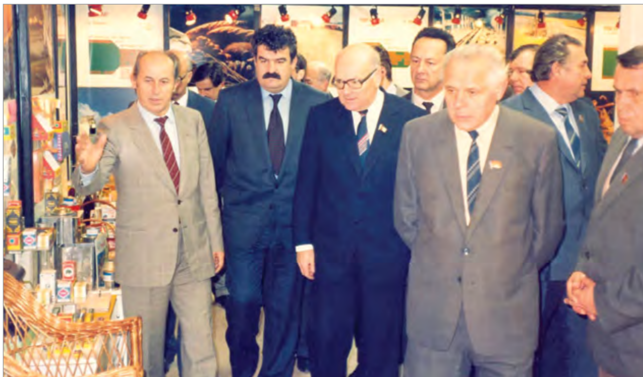
Югославская делегация у стендов с продукцией АПК «Кубань»