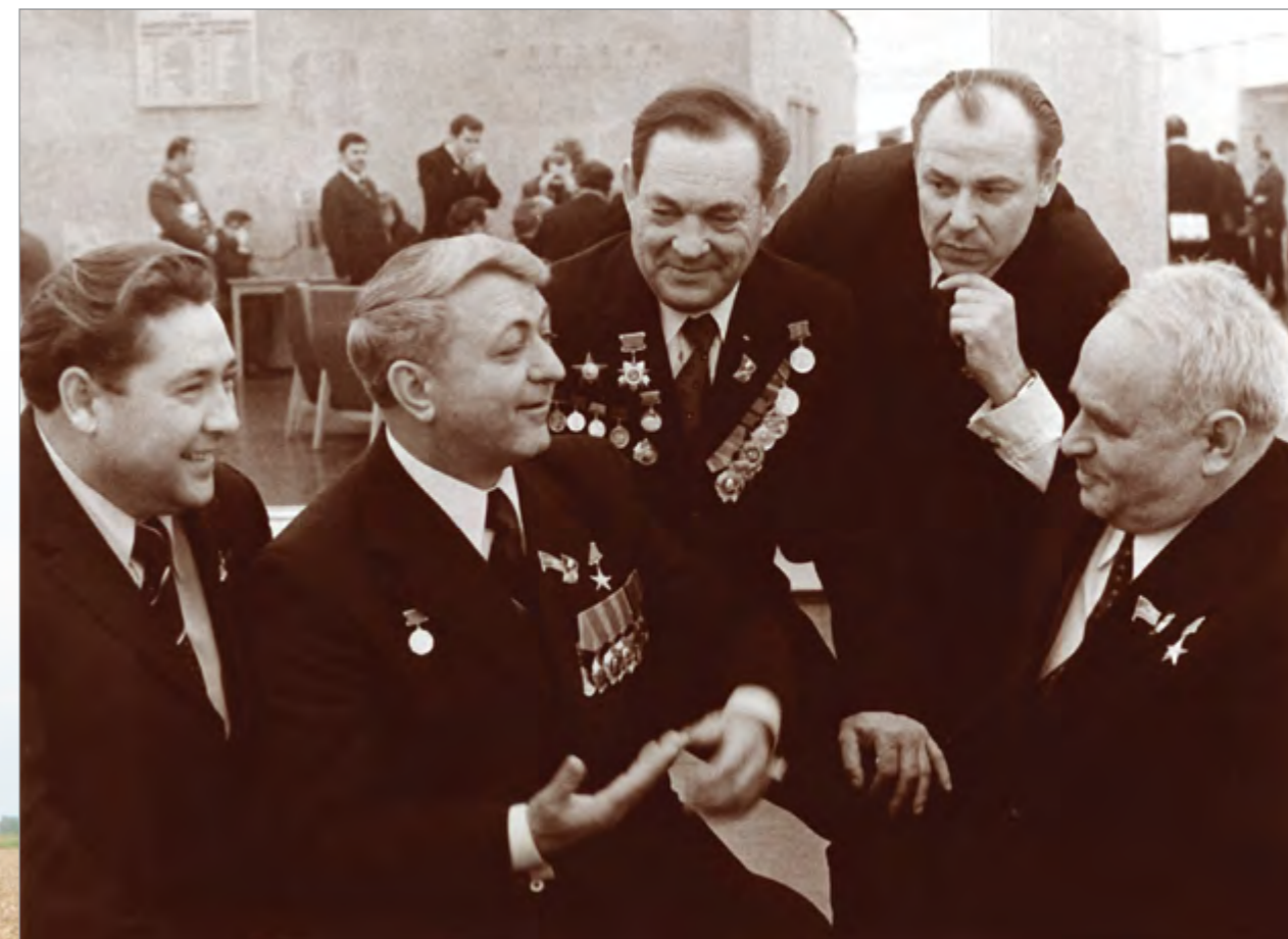
Группа делегатов от Краснодарского края на XXV съезде КПСС