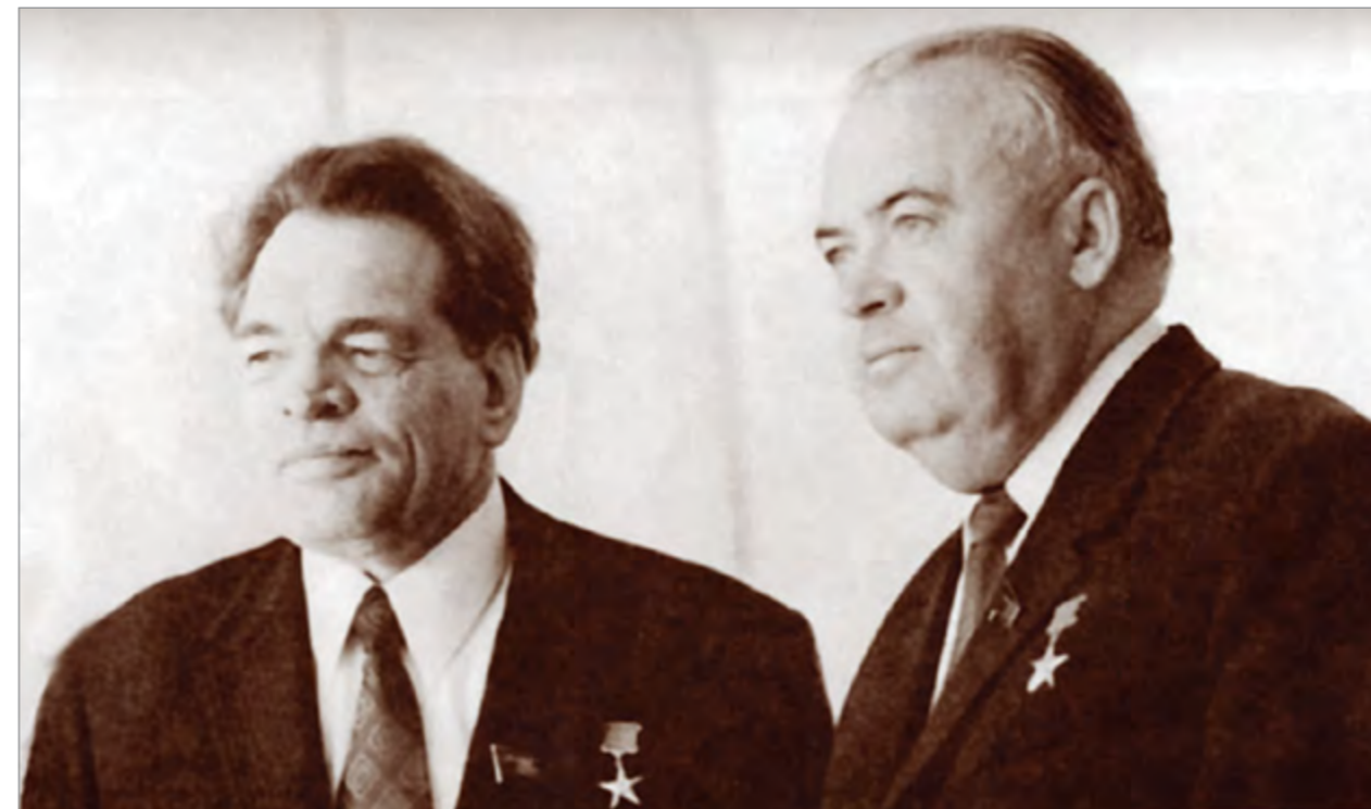
С. Ф. Медунов (справа), первый секретарь крайкома КПСС, и его предшественник на этом посту Г. С. Золотухин

В 1980 году закончилось строительство Краснодарского ипподрома. Кубанские скакуны были лучшими и в стране, и на европейских ипподромах.