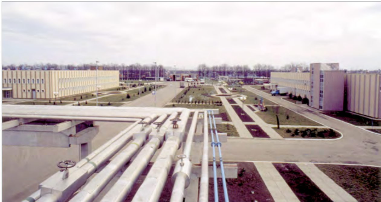
Так выглядели цеха комбината «Кубань»