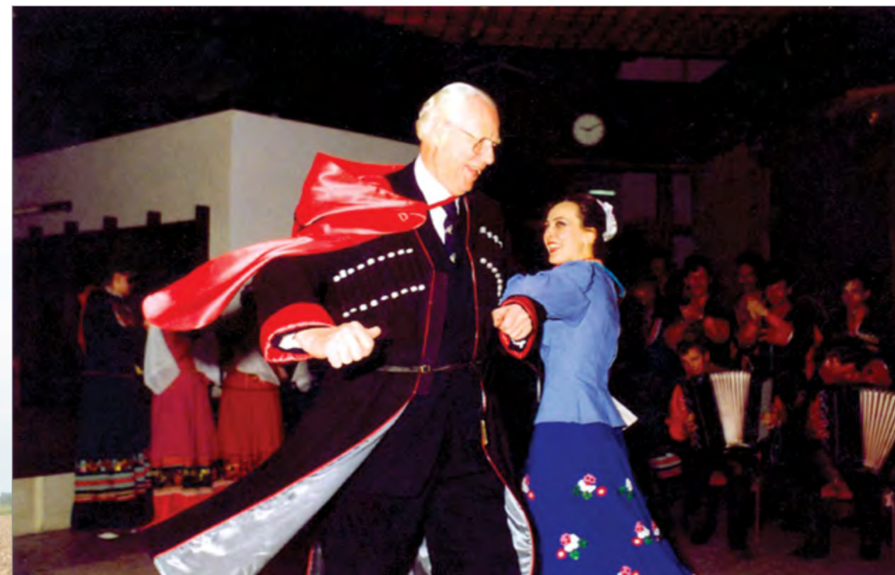
Встреча в Тимашевске доктора Рубена Раусинга и посвящение его в кубанские казаки