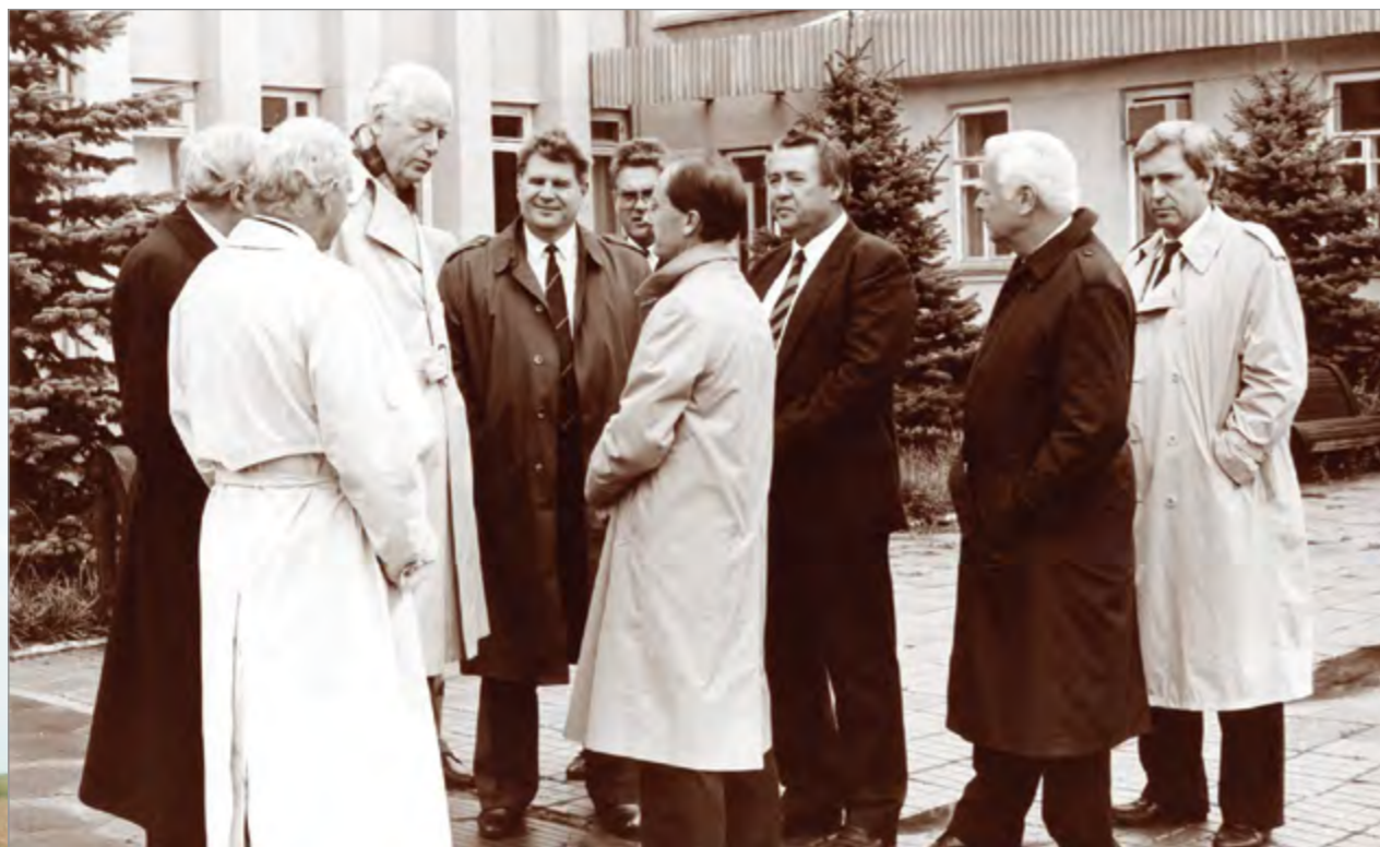
Представители фирмы «Тетра-Пак» в Тимашевске