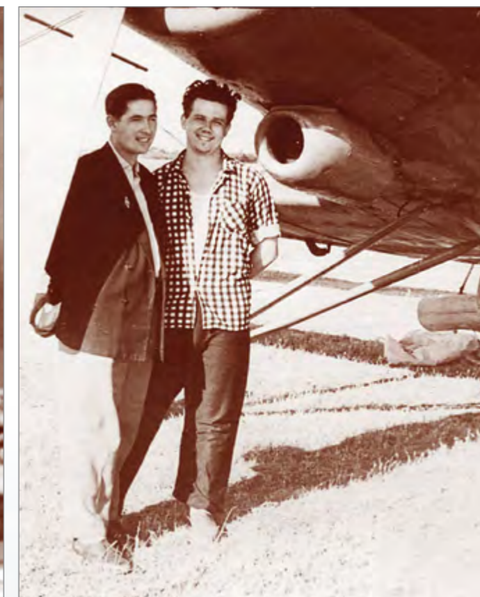
Первые рабочие будни старшего агронома колхоза «Советская Россия»