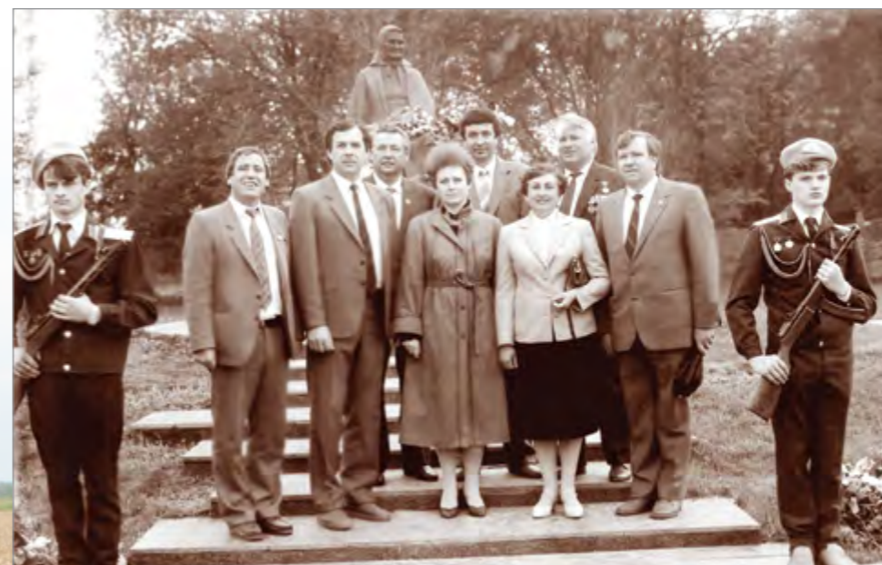
Работники администрации Тимашевского района на открытии отреставрированного дома-музея семьи Степановых