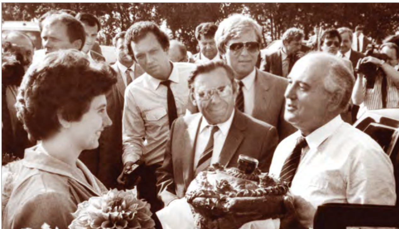
Знаменитый проезд М. С. Горбачева, генерального секретаря ЦК КПСС, в Тимашевский район 17 сентября 1986 года