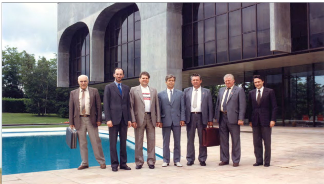
Во время ответного рабочего визита в Югославию