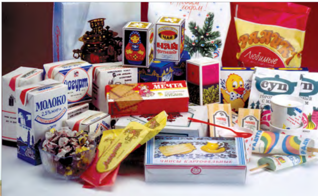
А такой в последующие годы была произведенная в этих цехах продукция