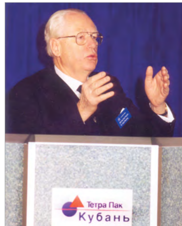
Основатель и глава всемирно известной фирмы «Тетра-Пак» Рубен Раусинг в Тимашевске