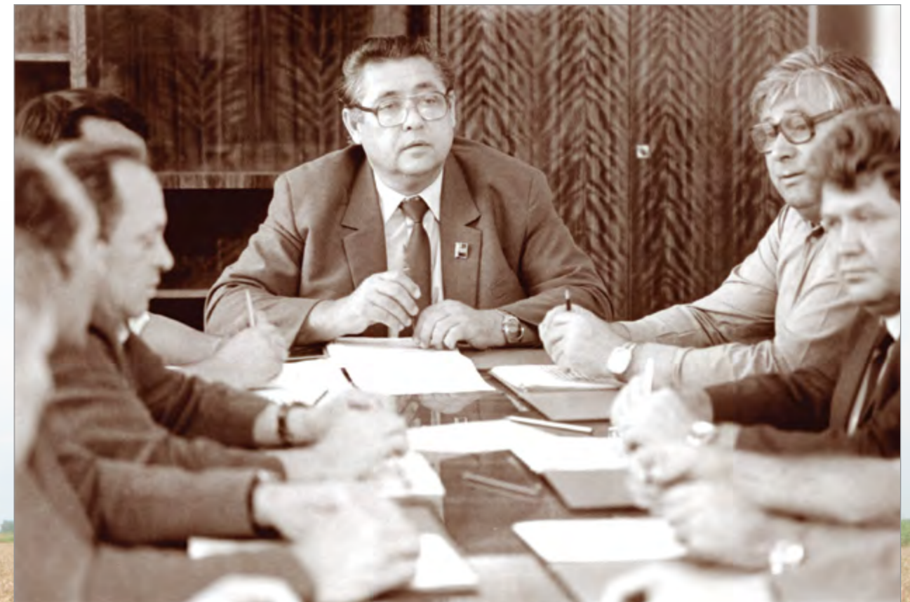
Заседание совета АПК «Кубань»

АПК «Кубань» был призван обеспечить повышение эффективности производства сельскохозяйственной продукции, ее хранения, переработки и реализации; улучшить снабжение местного населения продуктами питания; способствовать социальному пере-