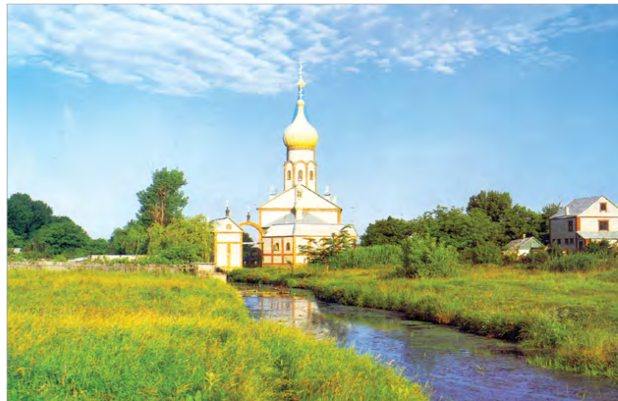
Свято-Духов монастырь в Тимашевске