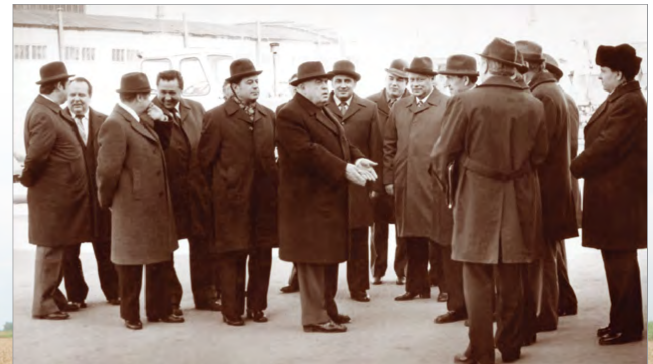
Краевое руководство во главе с С. Ф. Медуновым на выставке-семинаре по индустриальной технологии возделывания кукурузы и подсолнечника. Март 1981 г.

Краевое управление сельского хозяйства владело громадными ресурсами и совместно с партийными органами имело влияние на производственную сферу.