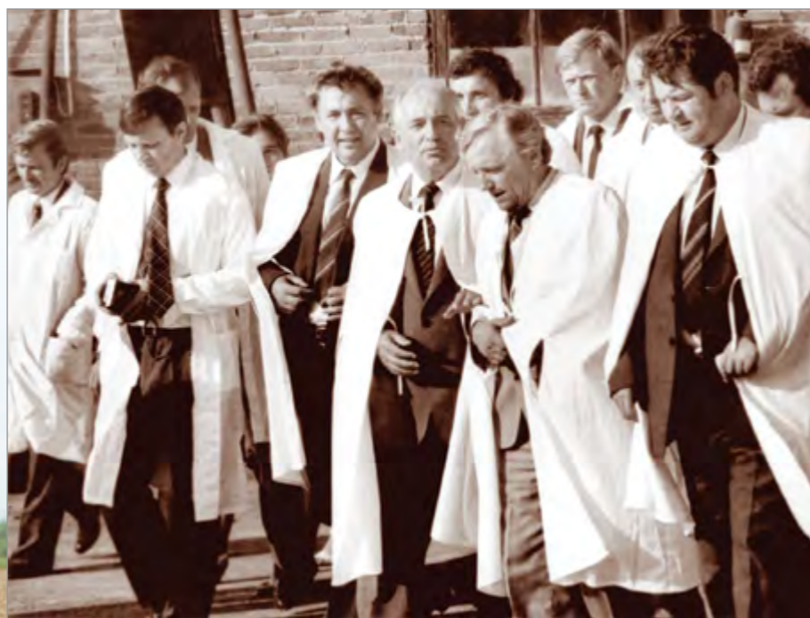
На территории молочного комбината колхоза «Искра»