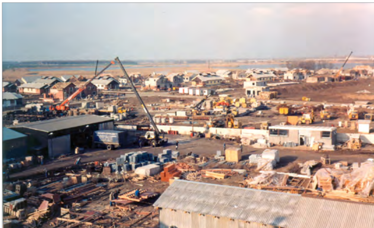
Так начиналось строительство АПК «Кубань»