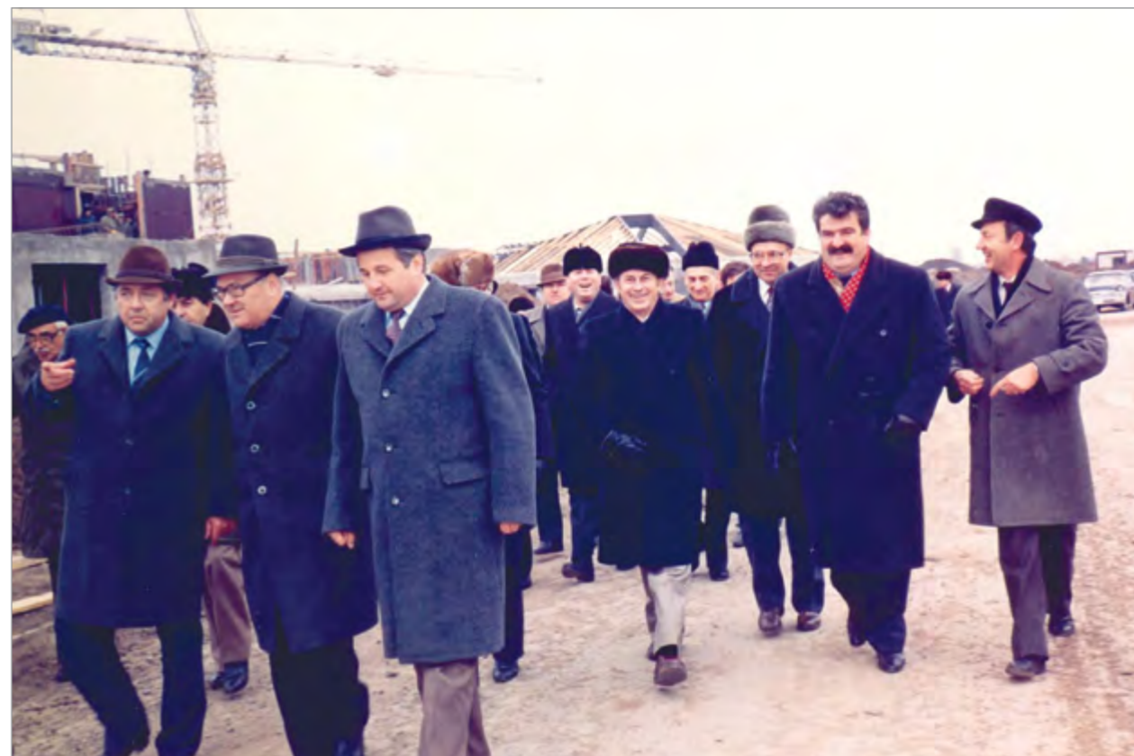
Посещение АПК «Кубань» делегацией Сербии (СФРЮ, 1986 г.). В начале 1987 года на строящихся объектах АПК «Кубань» трудились 1200 югославских рабочих