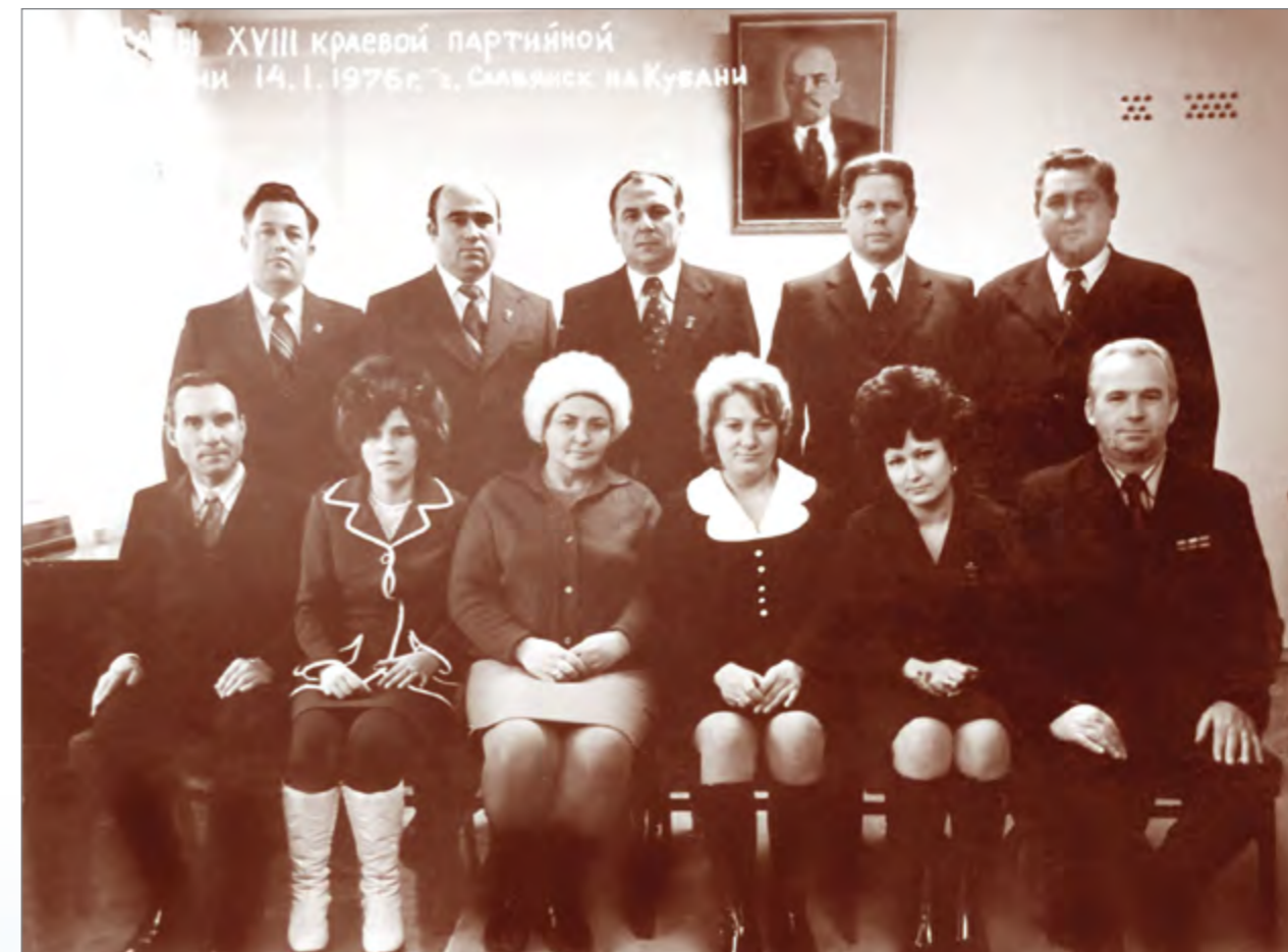
Делегаты XVIII краевой партийной конференции от г. Славянска-на-Кубани. 1976 г.

1978 года главный комитет ВДНХ СССР награждает Михаила Михайловича Ломача серебряной медалью.